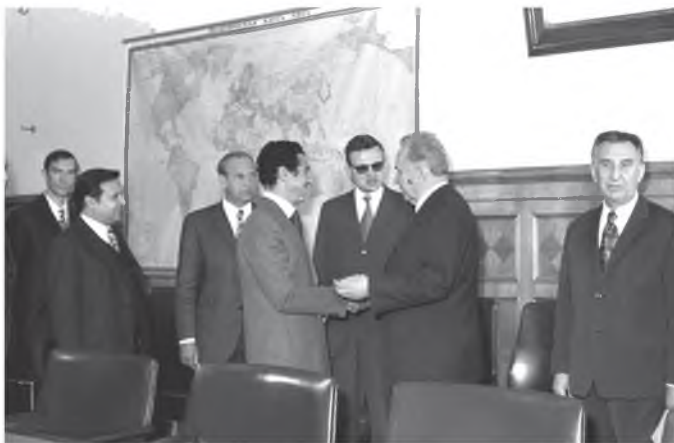
أثناء زيارة عبد السلام جلود للاتحاد السوفياتي، وجانب من لقاءه الأمين العام للحزب الشيوعي السوفياتي ليونيد بريجنيف، 1974 / 5 / 16.